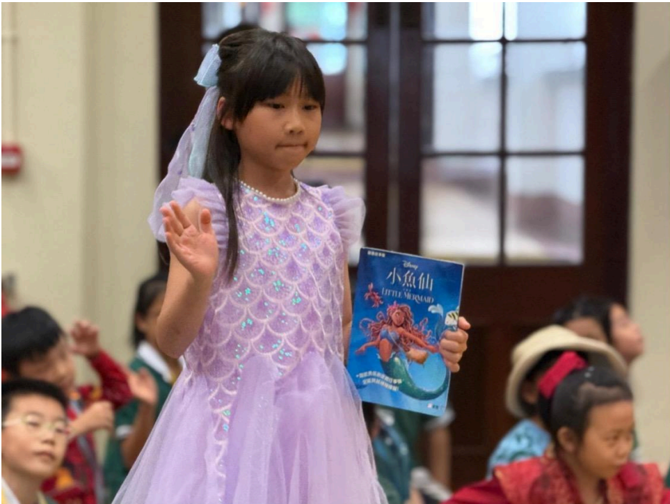
護護海洋的小魚仙。