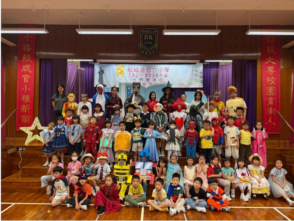
般咸道官立小學於世界閱讀日舉辦“書中角色，星光大道”。

今天(4月23日)是“世界閱讀日”，般咸道官立小學舉行了一場別開生面的“書中角色大匯演”活動。整所校園化身為沉浸式巨型故事舞台，校方透過跨學科的課程統籌規劃，讓全校師生從“看書”進化為“入書”，藉由角色扮演與多模態閱讀學習，展現師生對經典角色的深刻理解，將文字轉化為正向價值觀與校園幸福感。