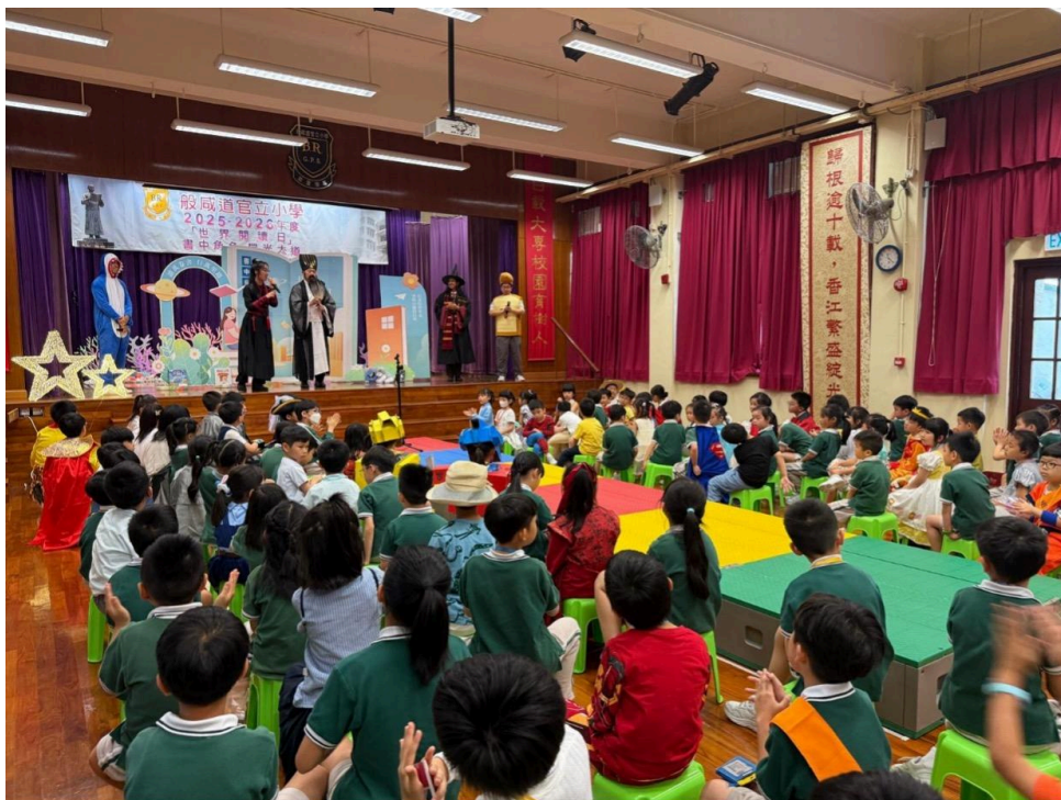
“書中角色，星光大道”，學生樂在其中。

在學生層面，課程統籌展現了嚴謹的學習階梯：一、二年級以繪本啟發感知；三年級透過寓言學習人生哲理；四年級聚焦海洋生物，建立責任感；五、六年級則分別探索童話與神話，深化文化素養與正向品格。