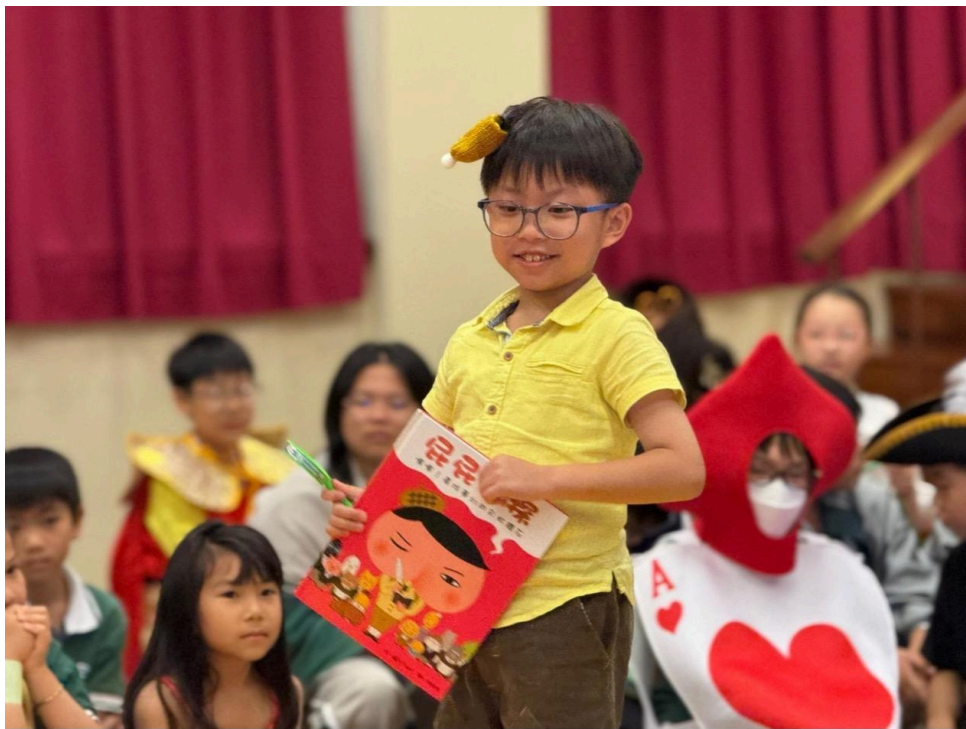
冷靜又幽默的屁屁偵探。