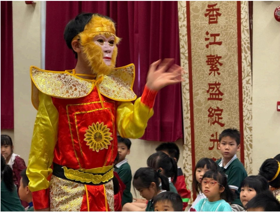
充滿智慧的齊天大聖孫悟空。