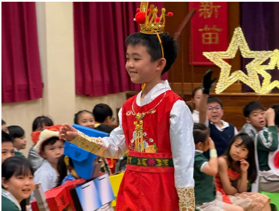
《紅樓夢》中善良的賈寶玉。

般咸道官立小學表示，活動最終回歸學生的幸福感。透過課堂分享、禮堂走秀及手工創作，學生在參與中找到成就感。這種將課程、價值觀與趣味性完美揉合的教學模式，讓閱讀成為一場親身參與的大冒險，為學生的成長注入了深厚的人文關懷與幸福能量。