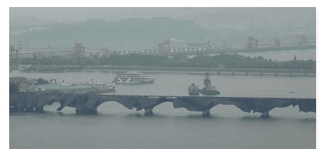
湖北宜昌·葛州壩長江溪土樁樁破拆除