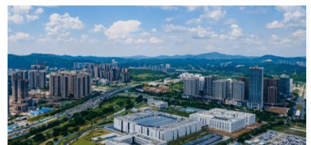
福建多地構建台胞住房保障體系