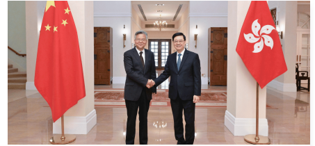
李家超與湖北省省長李殿勳會面